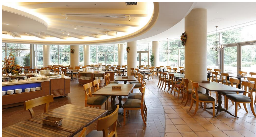
朝食会場:レストラン セントロ